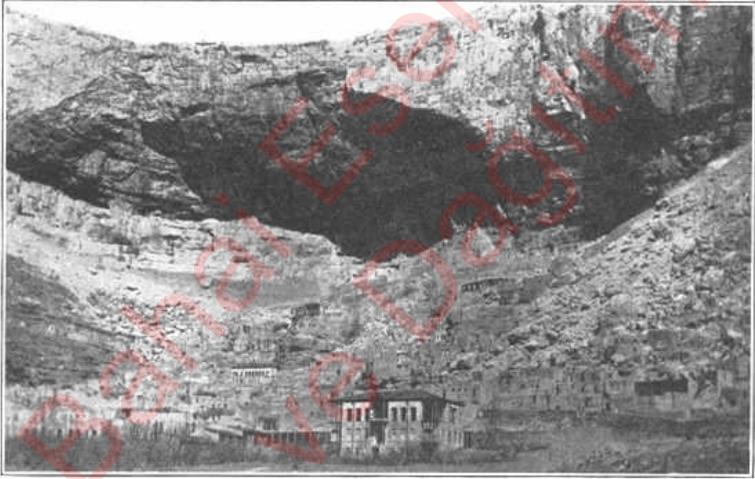
( Maku kalesinin kalıntısı )

Kıdem Sultanı kendi kendine hiçbir şeye gereksinim duymaz, ne varlıkların sevgisinden bir fayda elde eder, ne de onların kötülüklerinden zarar görür. Her şey topraktan gelmiştir ve O'na dönecektir. (Hz. Bahauallah, Maide-i Asemani, Cild 7 )